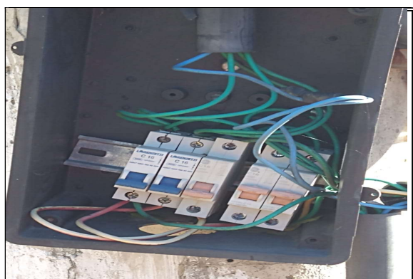
quadro de distribuição de circuitos a trocar junto com disjuntores e cabeamento