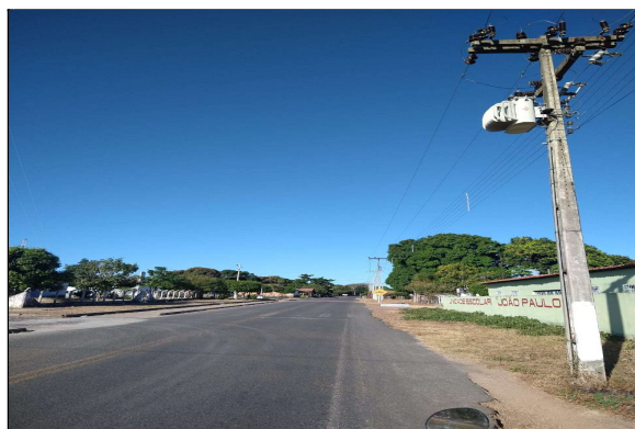
visão do transformador existente (15kva) em relação a praça