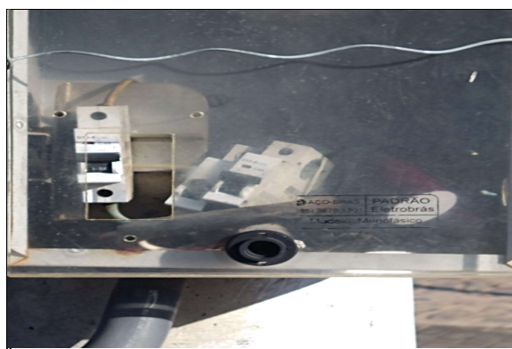
quadro de medição a trocar