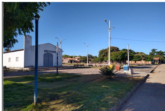
visão geral da praça