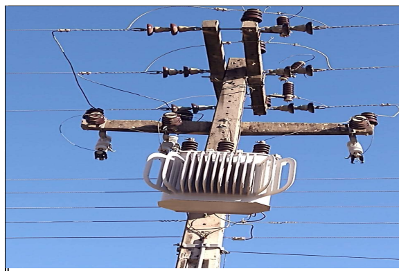
transformador existente 15kva